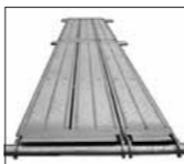
ライトウォーク システム足場対応布板 仮設工業会認定品