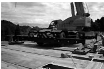
鋼殻パネル上からの架設状況

鋼殻パネル上を使った施工が可能であるため、仮設橋などを省略でき、他に類を見ない施工性を発揮します。